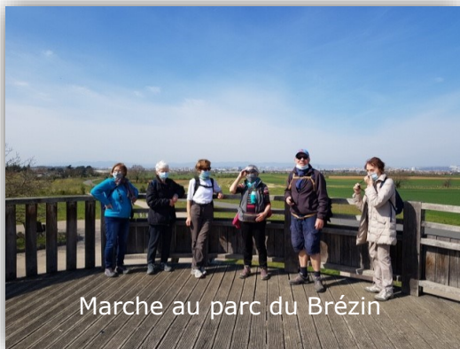
Marche au parc du Brézin