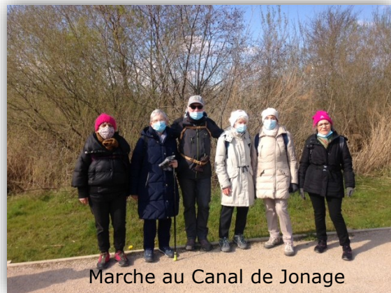
Marche au Canal de Jonage