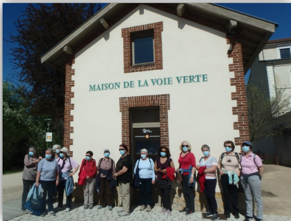
Balade sur la voie verte de Caluire